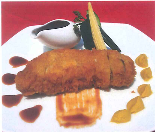
ロースカツ + サラダ ¥1,300 -