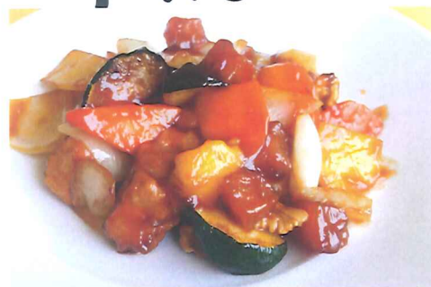
酢豚 花畑里風 + サラダ ¥1,400 -