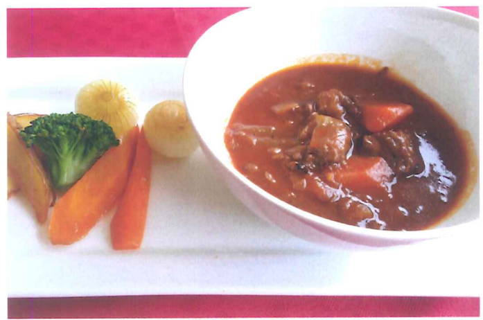
ビーフシチュー + サラダ ¥1,800-