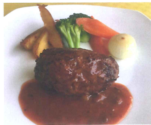
ハンバーグ + サラダ ¥1,500-