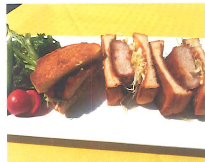
ロースカツサンド + デザート ¥1,200 -