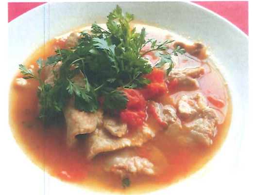
豚とトマトの 炒め物 + サラダ ¥1,400 -